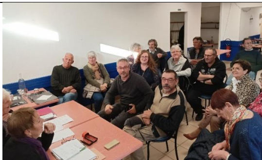
Assemblée Générale du 17 mai 2023 : les comédiens « en civil »...mais pas sans humour !