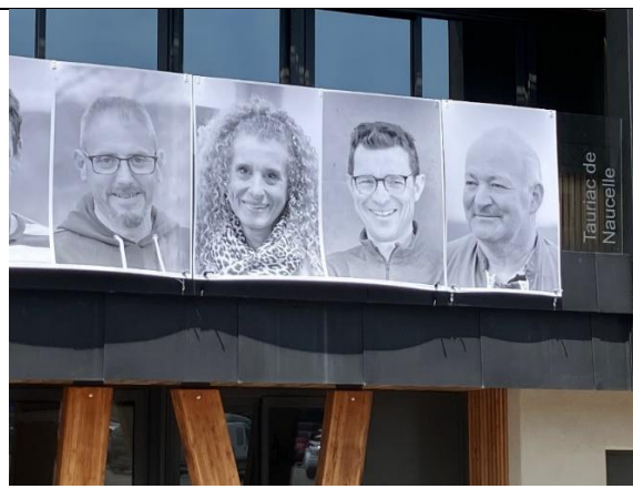
Sur le fronton du bâtiment de « Pays Ségali » à Baraqueville