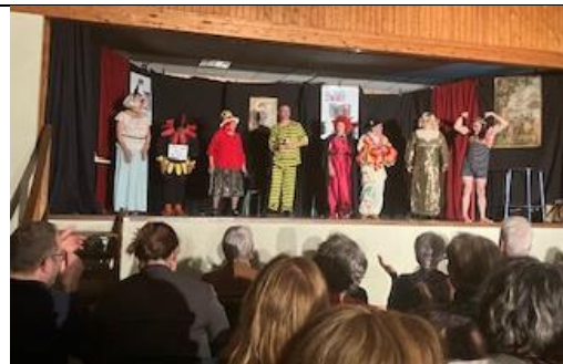
Retour sur un moment fort de cette nouvelle saison théâtrale (Saint-Martial le 29 avril 2023).