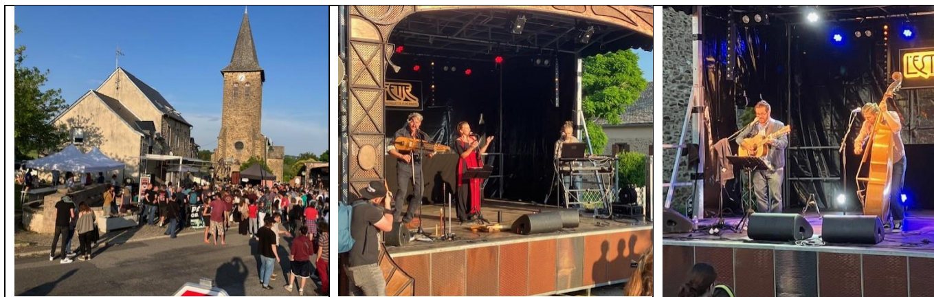
Un petit air rétro à Saint-Martial le 1 er juin ! L'inauguration de la guinguette itinérante « L'Estafette » à agréablement surpris les habitants présents. Du monde, de l'ambiance, une météo parfaite, tous les ingrédients d'une soirée réussie.

Fort d'un constat autour du manque de lieux propices au vivre ensemble en milieu rural, l'Estafette s'illustre comme le nouveau moteur de liens socioculturels. Cette scène itinérante répondra aux besoins pensés conjointement par les porteurs du projet (AJAL, Pollux Association, XFest organisation): autonomie technique, praticité, ergonomie, modularité et esthétique.