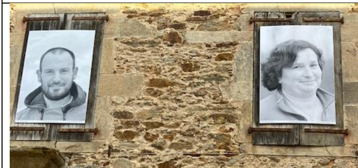
Sur le mur du presbytère et le fronton de la Mairie à Naucelle.