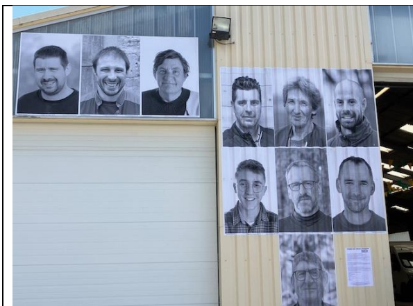
Sur le mur de la halle de Cassagnes Bégonhès