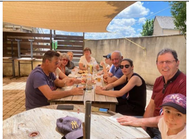
Pause déjeuner pour tous à l'Embuscade...Un peu de fraîcheur pour recharger les batteries avant une après-midi caniculaire !